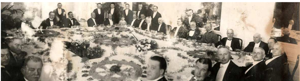
I ricordi del cuore... - Nella foto la prima riunione dei Soci al Grand Hotel Baglioni, il 7 marzo 1925

Primo segno della triplicità dell'Acqua, cardinale, femminile, governato dalla Luna, il Cancro è il segno della sensibilità, della timidezza e della scarsa combattività. È il segno del legame con la terra natale, con la famiglia, con la madre e con la tradizione, dell'amore per la casa.