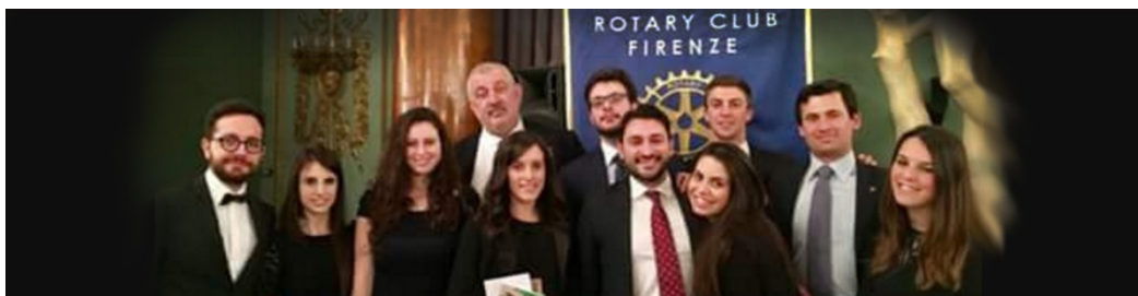
Il Rotaract Club Firenze PHF festeggia i suoi 49 anni di... "amicizia e servizio". Primo club in Europa e terzo nel mondo

Prenotazione tassativa entro le ore 12 di mercoledì 26 aprile