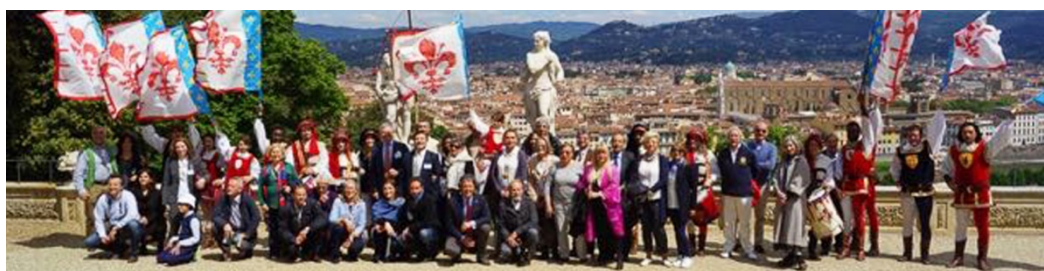
Conclusione dei lavori del convegno UNESCO. Un saluto da Firenze con gli sbandieratori