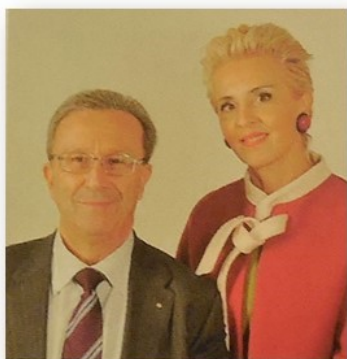
Visita del Governatore del nostro Distretto 2071 Alessandro Vignani